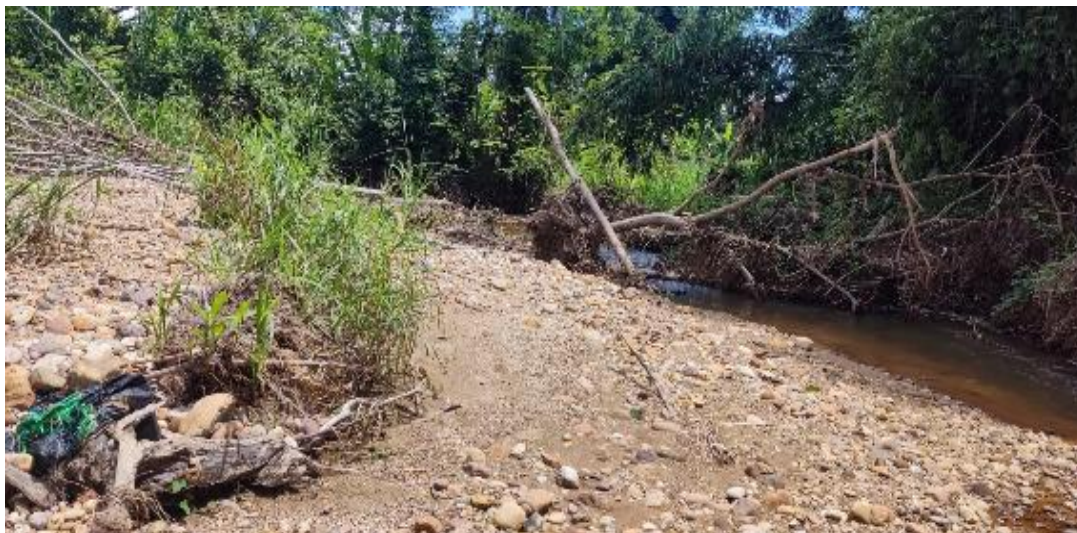
FIGURA N°01: TRAMO DEL ARABECOLMATADO, AFECTANDO SEMBRIOS DE PLATANO, CACAO, PAPAYA