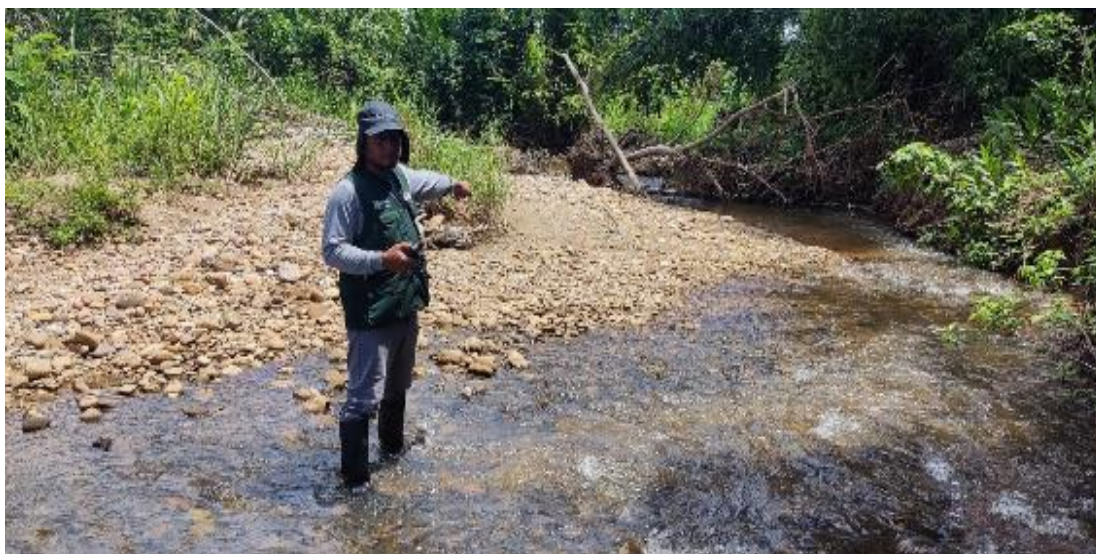
FIGURA N°02: TRAMO DEL RIO NEGRO COLMATADO, AFECTANDO SEMBRIOS DE PLATANO, CACAO, PAPAYA